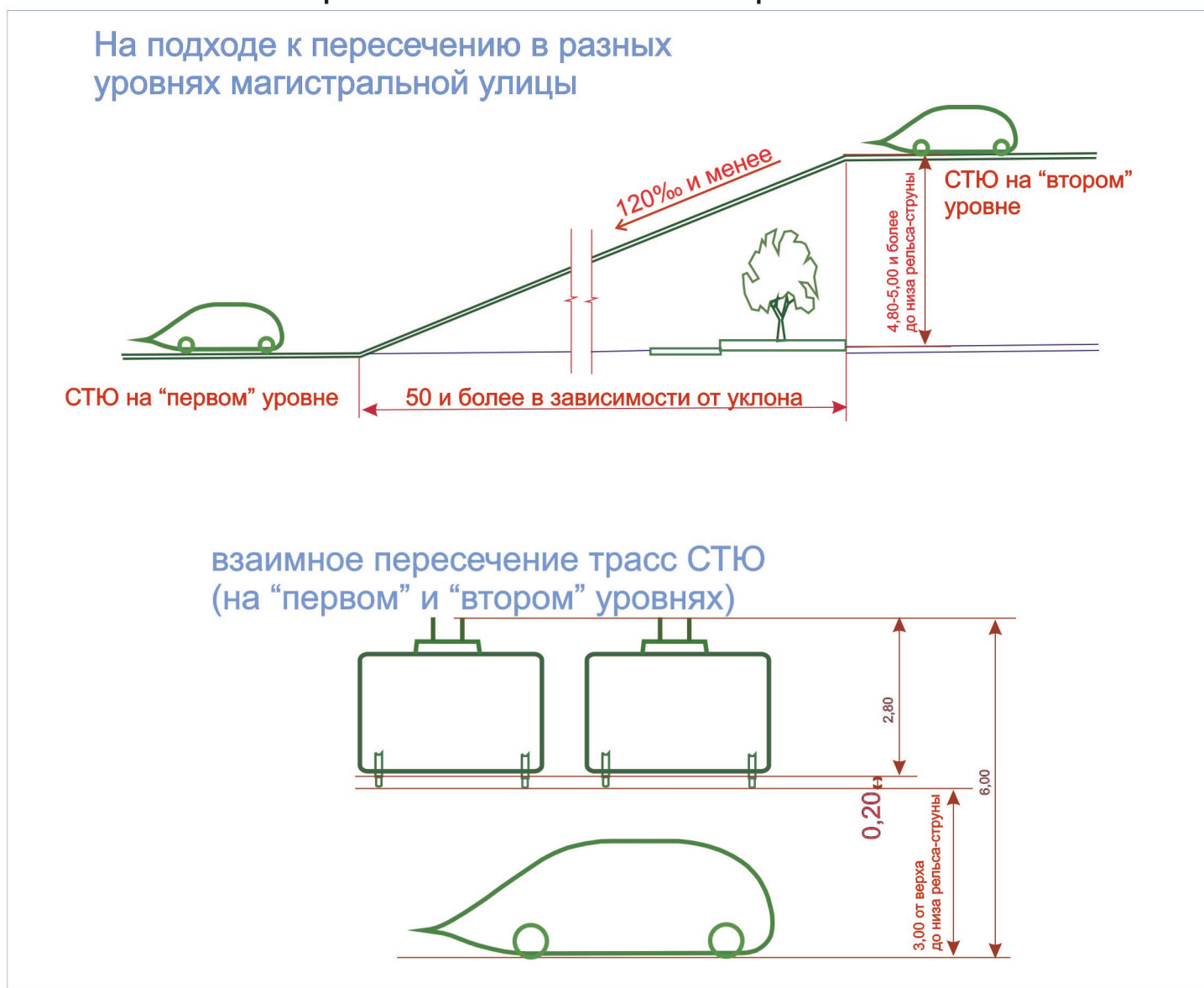
Габариты линии СТЮ на пересечениях