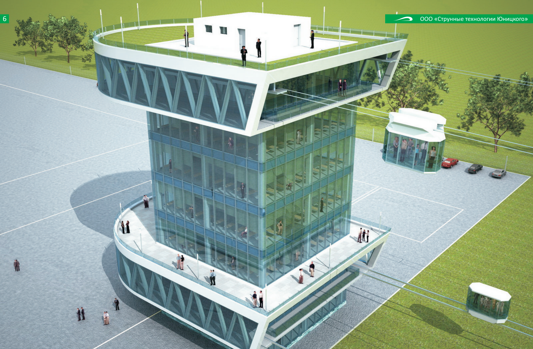
Станция пересадки навесного и подвешного СТЮ, совмещенная с офисным центром