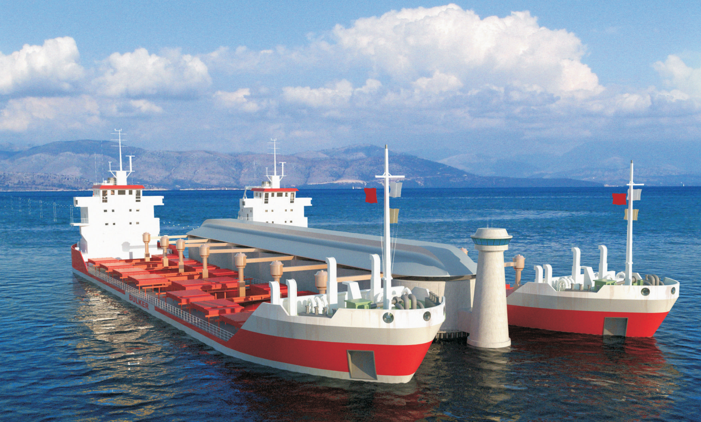
Погрузка руды одновременно в 2 балкера