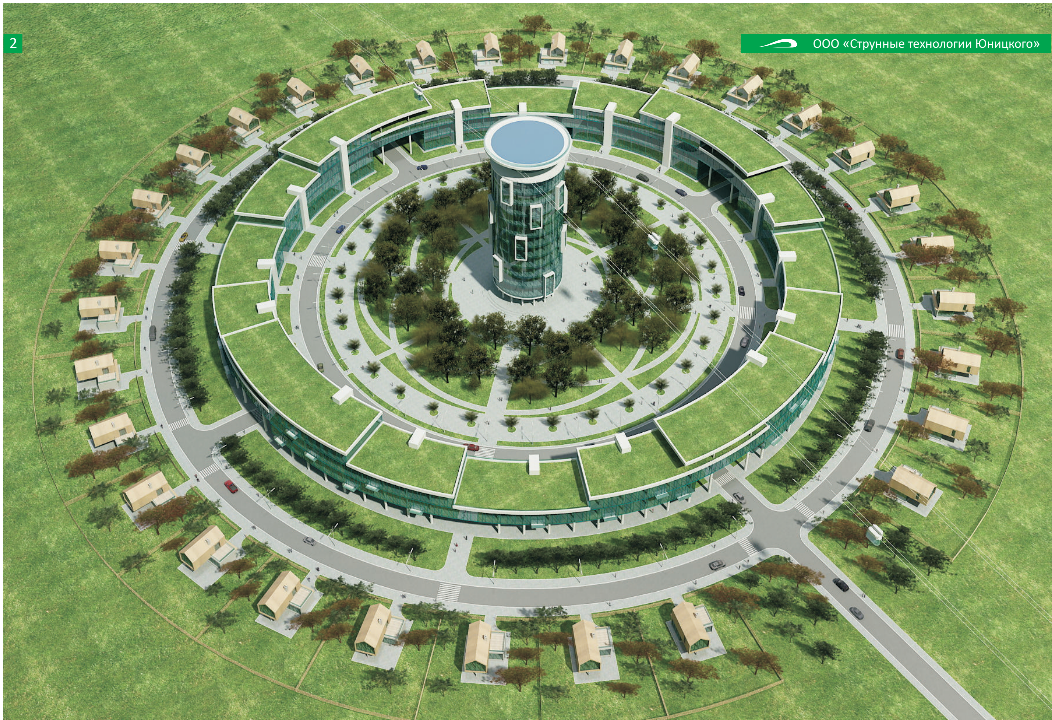
Загородный жилой комплекс «Оазис» (выполненный на основе технологий СТЮ)