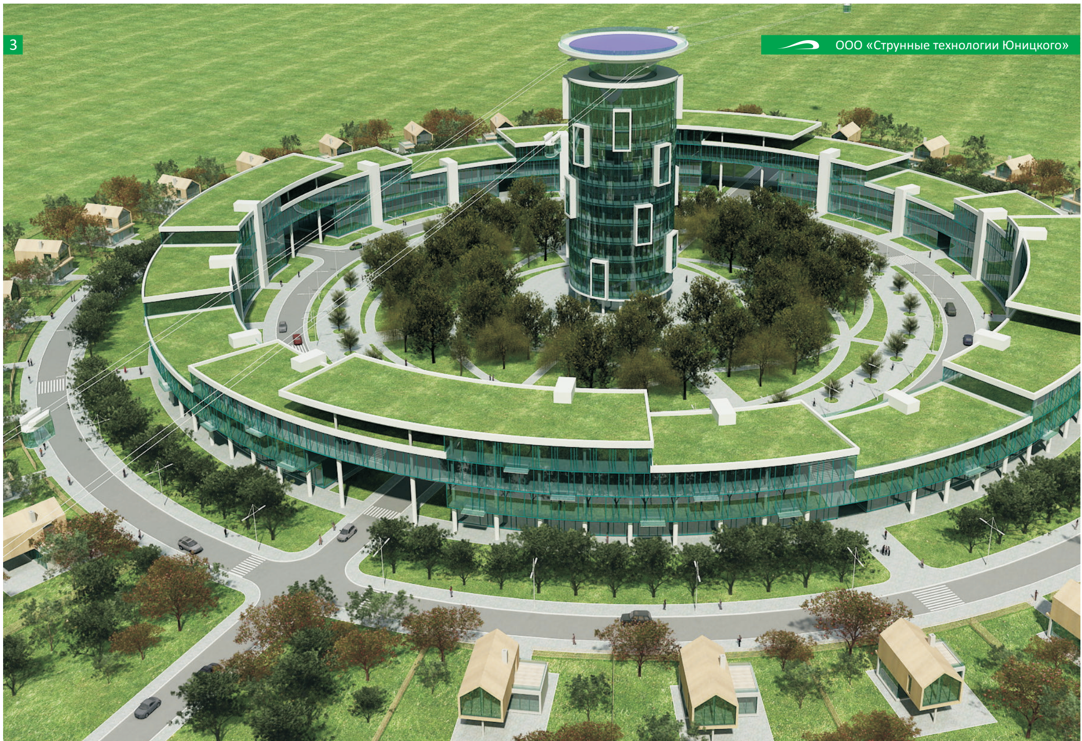
Загородный жилой комплекс «Оазис» (выполненный на основе технологий СТЮ)