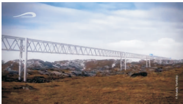
Эстакада на пересечённой местности с технологическим транспортом наверху