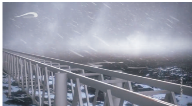
Эстакада в зимний период времени