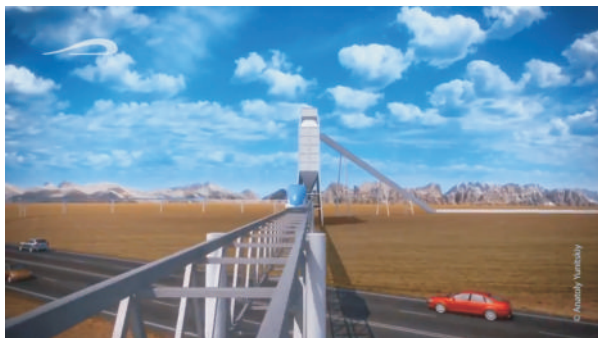
Терминал погрузки угля и технологический транспорт (сверху эстакады)