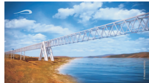
Анкерная опора (через каждые 5 км)