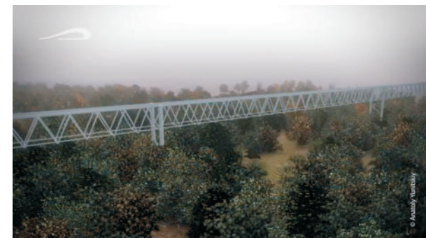
Прохождение эстакады через зелёные насаждения