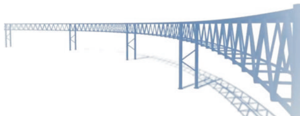
Эстакада на горизонтальной кривой малого радиуса