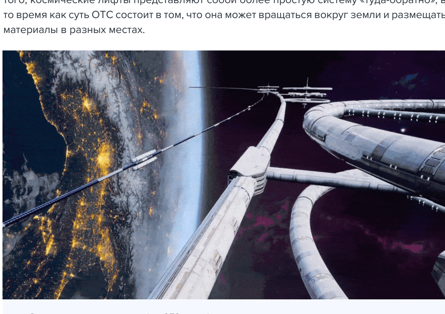
В отличие от космического лифта, ОТС способно делать остановки на многих станциях по всему миру.

Конечно, характеристики этих лифтов отличаются от ОТС Юницкого. Большинство материалов, необходимых для ОТС, уже широко используются, в то время как разработчики нескольких видов космического лифта ждут появления для своих конструкций углеродных нанотрубок или других элементов, у которых даже еще нет названий. Кроме того, космические лифты представляют собой более простую систему «туда-обратно», в то время как суть ОТС состоит в том, что она может вращаться вокруг земли и размещать материалы в разных местах.